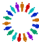
II CONFERENCIA ESTRATEGICA