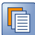
DOCUMENTO PROPOSITIVO DEFINITIVO