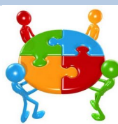
MESAS DE TRABAJO