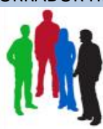
CONSEJO DE SOSTENIBILIDAD